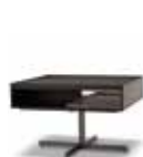
9 CLOSE BEISTELLTISCH CM 80X80 H53