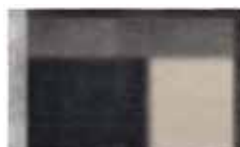
18 LANDFIELD "ECLIPSE" TEPPICH CM 500X300