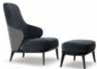
6-7 LESLIE BERGÈRE CM 68X94 H100 POUF CM 61X45 H34