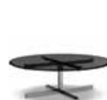
10 CATLIN BEISTELLTISCH Ø CM 113 H36